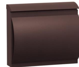
ラスティブラウン