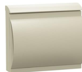
シーガルベージュ